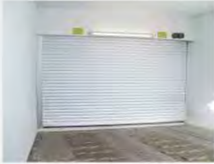
Tiefgaragen-Rolltor M7TG® Geschlossene Ausführung