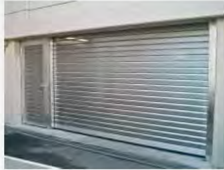
Tiefgaragen-Rolltor M10pTG® Von außen blickdicht - von innen transparent